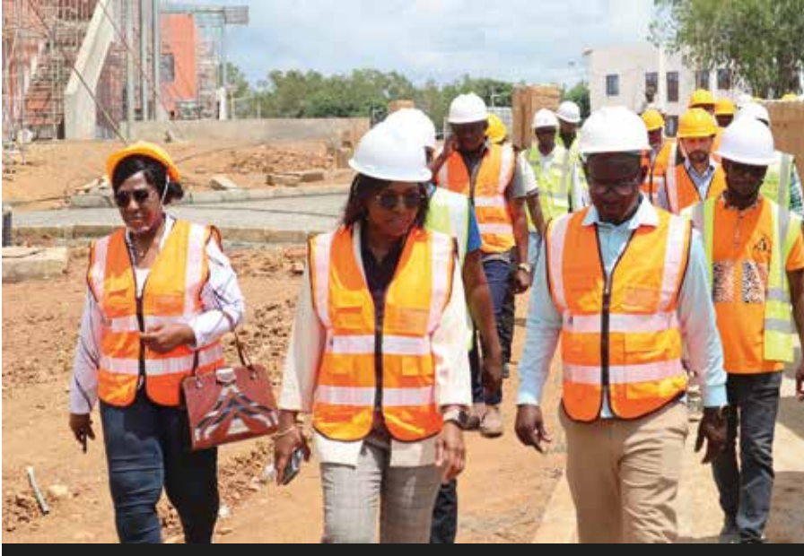
Le comité sur le chantier de construction