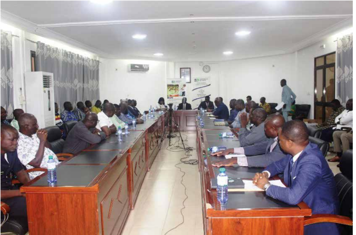
Vue de l'assistance à la cérémonie de passation

« Nous voudrions vous rassurer de notre engagement à poursuivre le noble travail déjà accompli par nos prédécesseurs pour le rayonnement de l'enseignement supérieur. »