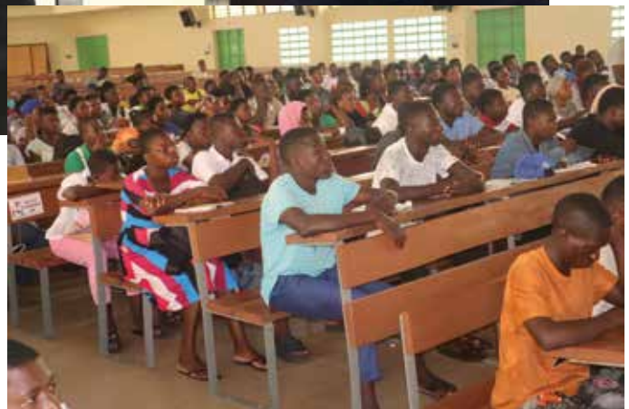
Vue partielle des étudiants

À travers cette initiative, la FLESH réaffirme sa volonté d'accompagner les étudiants dans leur intégration universitaire et de favoriser une meilleure appropriation des offres de formation.