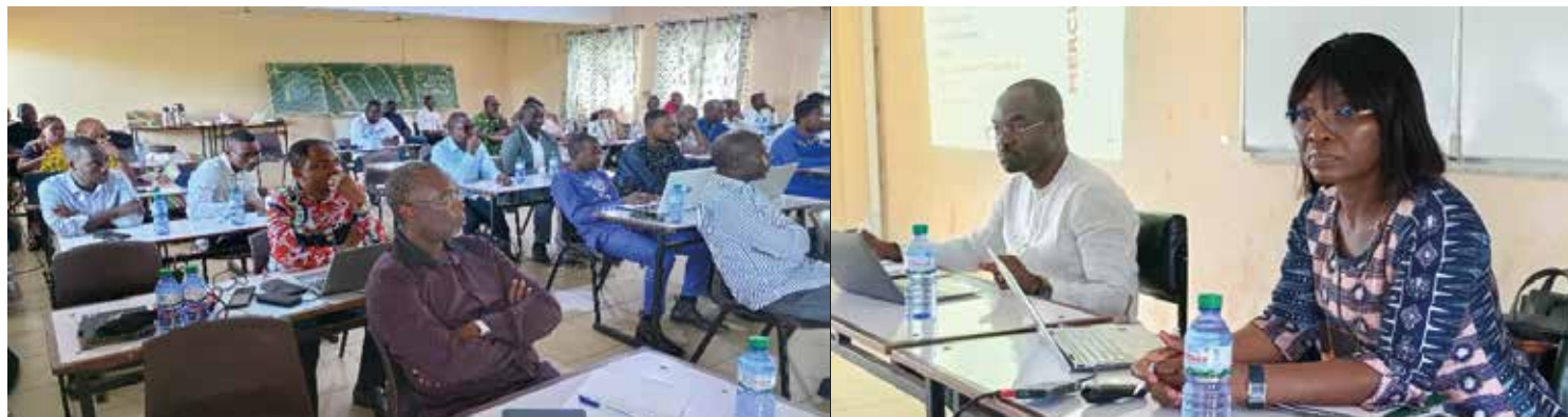
Vue de l'assistance au conseil de la FSS

Les 19 et 20 septembre 2025, la Faculté de des sciences de la santé de l'Université de Kara a tenu ses journées pédagogiques 2025. Doyen, vice doyen, chefs de départements, enseignants-chercheurs, personnels administratifs techniques et de services et délégués des étudiants de cette faculté se sont donné rendez-vous à l'ENAM de Kara pour faire le bilan de l'année académique 2024-2025 et réfléchir sur la dynamique à mettre en place pour mieux affronter la nouvelle année.