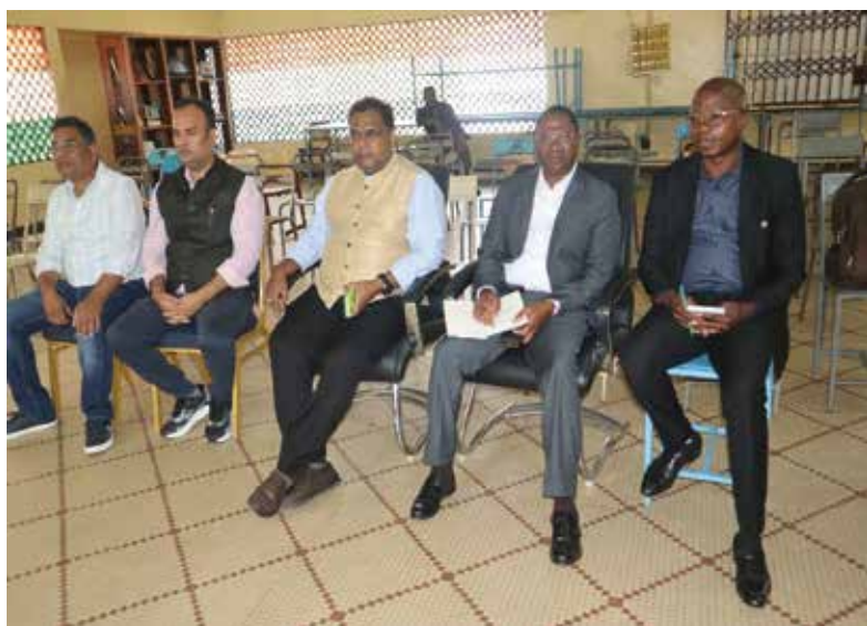
Les participants à la rencontre

La rencontre s'est achevée dans une atmosphère conviviale, traduisant la volonté partagée de consolider les liens déjà établis et d'ouvrir de nouvelles perspectives de collaboration.