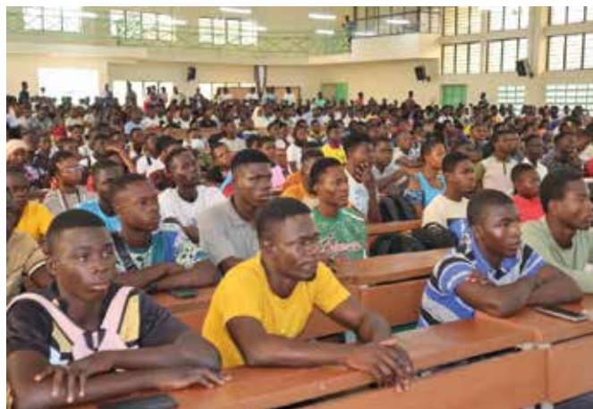
Des étudiants attentifs à la rencontre

En substance, les doyens et directeurs d'instituts ont détaillé les offres académiques et les procédures administratives d'inscription, avant de donner la parole aux étudiants lors d'une séance interactive. Les échanges ont permis de « clarifier de nombreux points et de rassurer les nouveaux inscrits », selon un étudiant interrogé. Plusieurs témoignages d'apprenants ont également mis en avant leur satisfaction et la qualité des informations reçues. « Nous repar- tons mieux informés et prêts à engager les démarches d'inscription sans crainte », a confié une nouvelle étudiante.