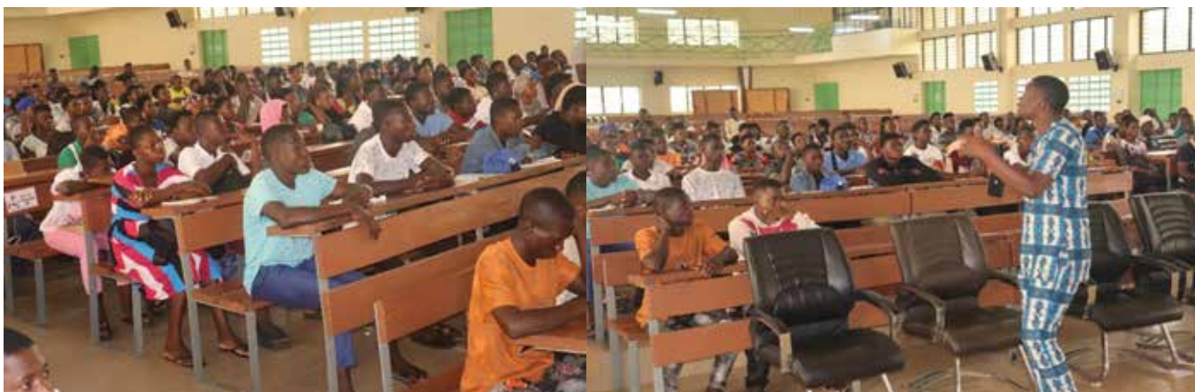
Vue de l'assistance